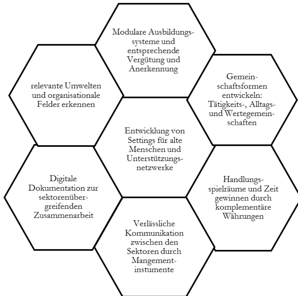
Abbildung: Entwicklung von Settings für alte Menschen und Unterstützungsnetzwerke 9

In der Zusammenschau von allgemeinen gesellschaftlichen und konkreten Entwicklungen einer diakonischen Einrichtung lassen sich Perspektiven (diakonischen Handelns) in einer alternden Gesellschaft entwickeln.